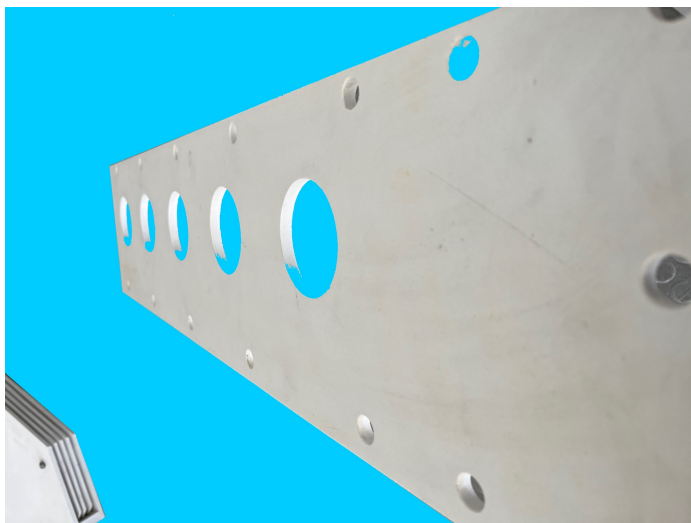
Dettaglio piastra per extrarapido Alsthom (CPTM)

Con i suoi materiali REFRARC P328 e REFRARC P90 F.lli Bigaran è in grado di fornire una gamma completa per i suoi clienti che intendono sostituire i materiali REFRAVER S ed ARCLEX