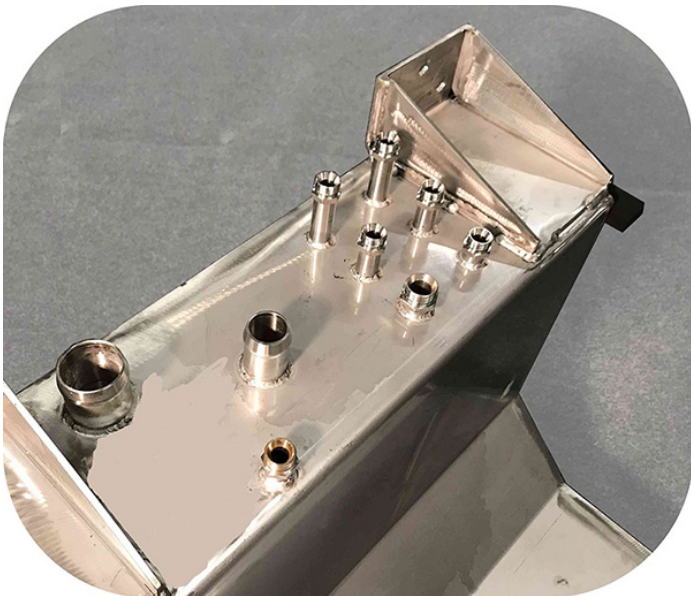
Dettaglio dei raccordi di collegamento